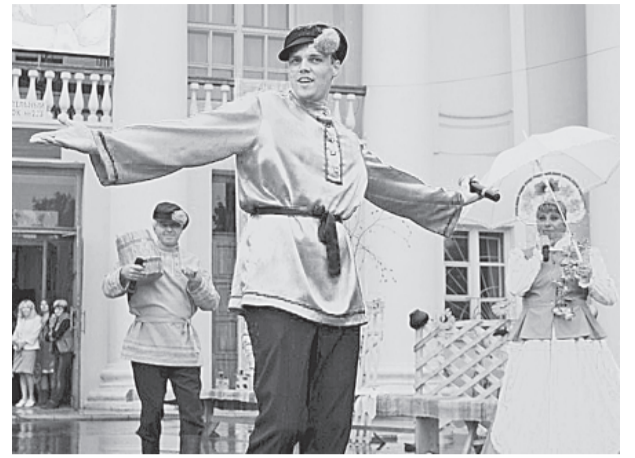
Актёры ДНТ приветствуют гостей Спасской ярмарки (август 2016 г.)

Накануне Нового года в Доме народного творчества дел невпроворот. Но дружный коллектив единомышленников всё же нашёл время поделиться с редакцией новостями и планами на будущее.