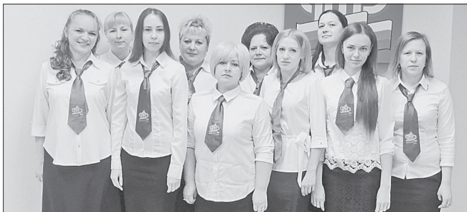
В очередной раз клиентская служба Управления Пенсионного фонда в Боровичском районе признана лучшей в области

Уважаемые работники и ветераны Управления Пенсионного фонда Боровичского района! Поздравляем вас с профессиональным праздником!